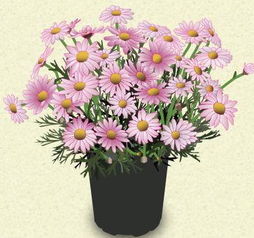
マーガレット (キク科) Argyranthemum frutescens

寒さ厳しい2月を過ぎれば、早春の陽ざしを浴びて、鉢植えのマーガレットが咲き始めます。花色は白をはじめピンクや黄色。「マーガレット」の語源は、エーゲ海で採れる白玉の真珠に喩えられ、ギリシア語の「真珠 = margarites」と言われています。また女性につける代表的な名として、十五世紀のヘンリー六世の妻・マーガレット由来という説もあります。いずれにしても、清楚な美しさにふさわしい響きです。日本に渡来したのは明治時代、和名はモクシユンギク。葉が春菊に似て茎が木質化することから「木春菊」と。ずいぶん愛想のない名が付けられました。明治後期から大正時代にかけて、頭髪を大きな三つ編みの輪にしてリボンをつける洋風結髪「マガレイト」が、当時の女子学生に流行しました。マーガレット人気の威力です。花は7月頃まで咲き続けます。明るい陽ざしに負けない力強い輝きがあります。