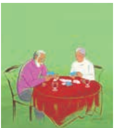
表紙 / ステイホーム2 川村みづえ 新年を迎えても 孫たちと集うこともないし 久しぶりのカード遊び